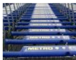
L'allemand Metro réduit ses pertes