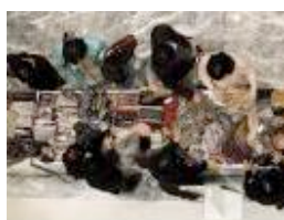
Amazon, Yves Rocher et vente-privée.com, sites ...